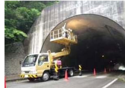
写真2 トンネル点検状況

トンネル点検は、日常の道路パトロールを行うとともに、5年に1度「道路トンネル定期点検要領（平成31年2月 国土交通省道路局）」に基づく定期点検を近接目視により実施し、トンネル本体工とトンネル内付属物の状態を確認します。