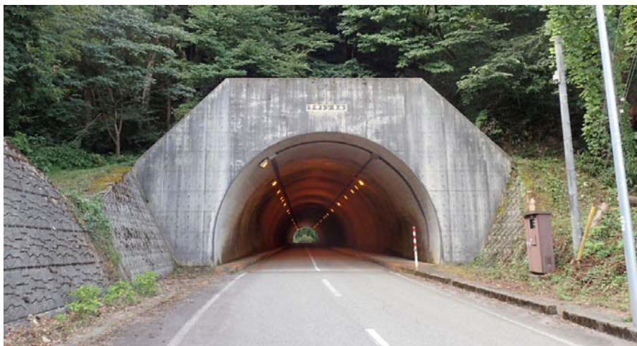
写真1 下中トンネル全景